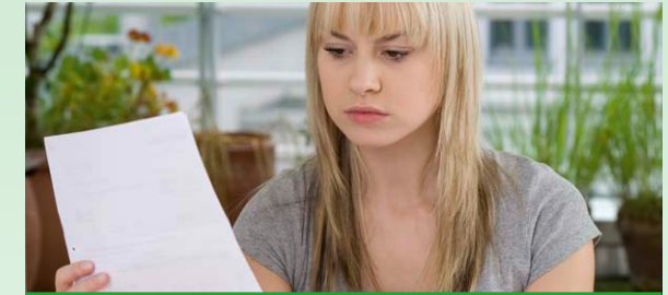
Kaufmann/-frau für Büromanagement